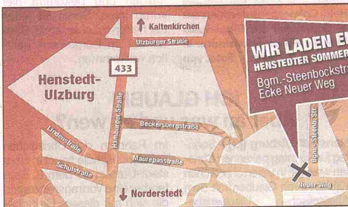
So kommen Sie zum Fest.