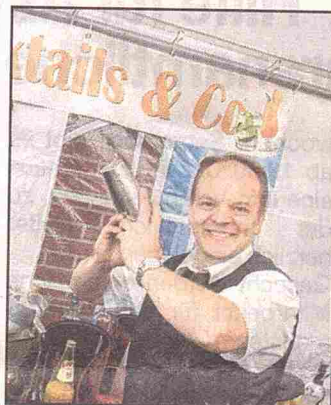
Köstliche Cocktails gibt es an der Cocktailbar von insign-media.